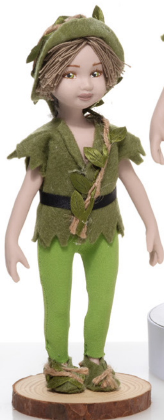
AV23-GA828 h. 22 cm