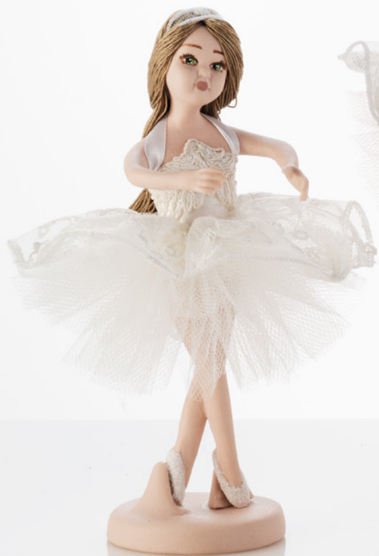
AV23-GA850 h. 18,5 cm