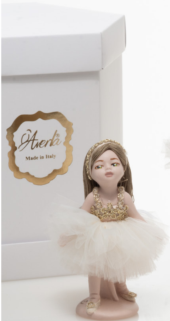
AV23-GA806/3 h. 13 cm