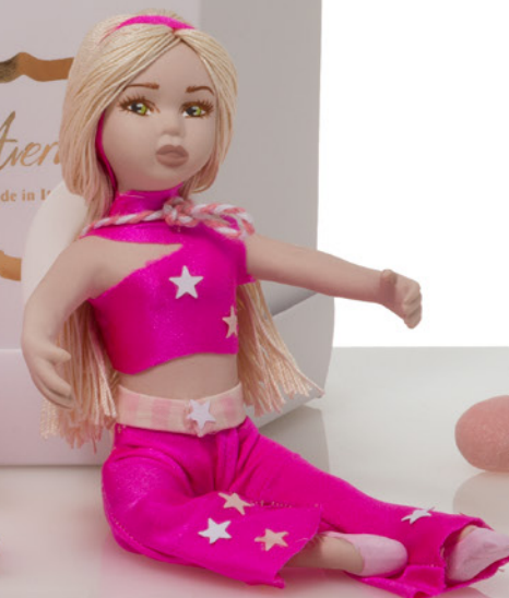
AV23-GA876 h. 12 cm