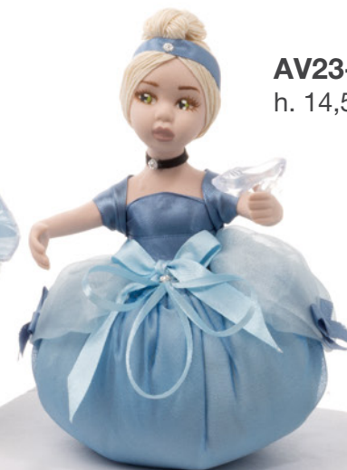
AV23-GA816 h. 14,5 cm