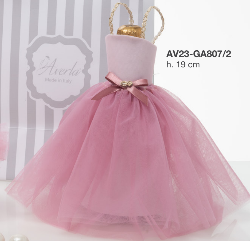
AV23-GA807/2 h. 19 cm