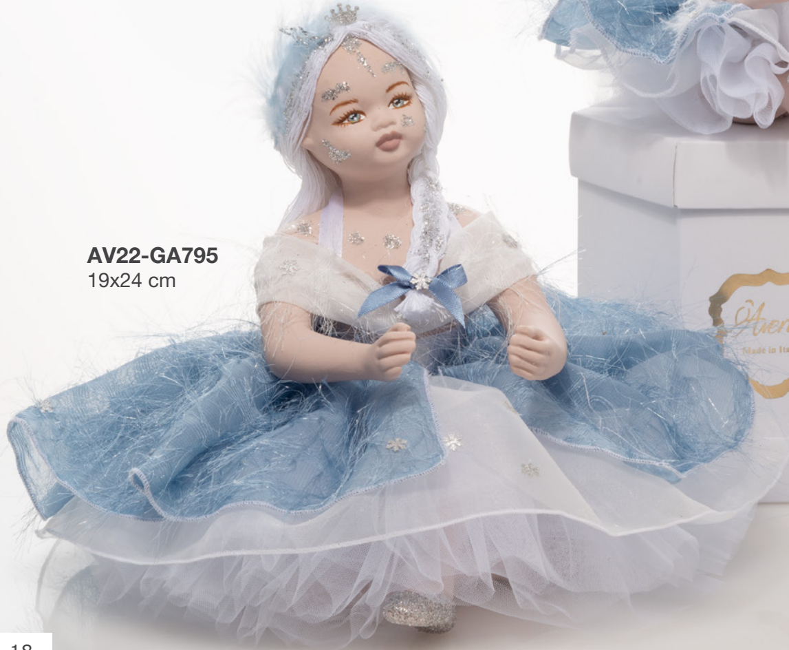
AV22-GA795 19x24 cm