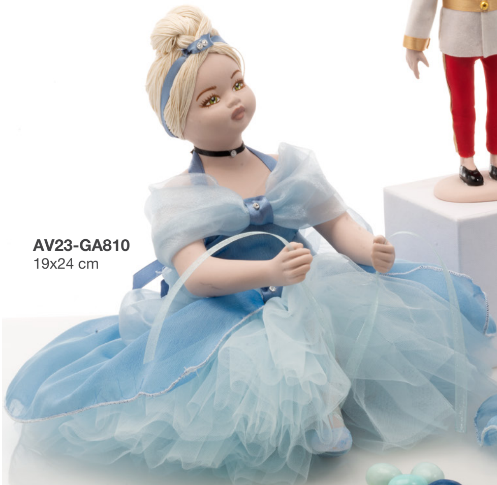
AV23-GA810 19x24 cm