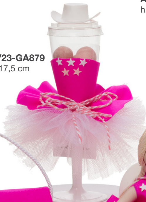
AV23-GA879 h. 17,5 cm