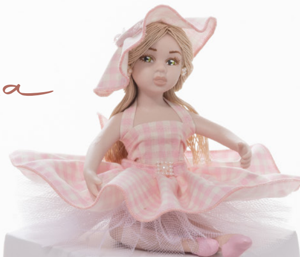
AV23-GA862 h. 12 cm