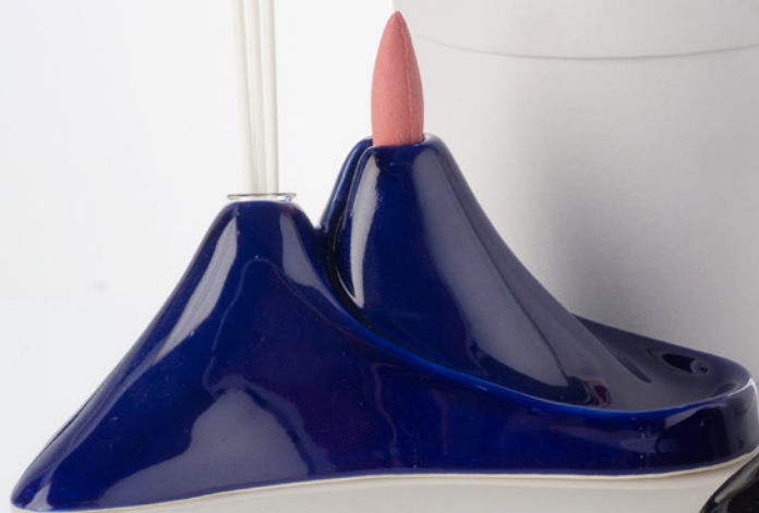
AV23-GA900/5 19,5x8,5 cm