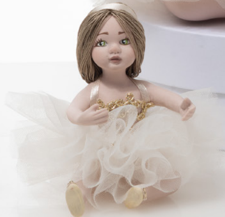
AV23-GA803/3 h. 9 cm