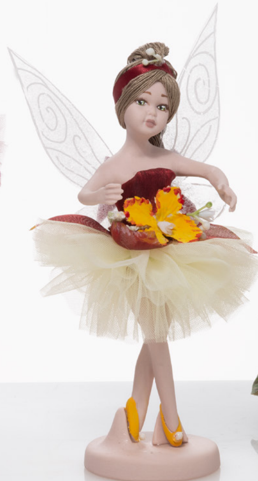
AV23-GA826/3 h. 18,5 cm