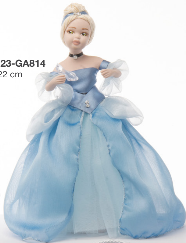
AV23-GA814 h. 22 cm