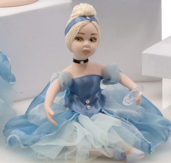
AV23-GA812 h. 12 cm