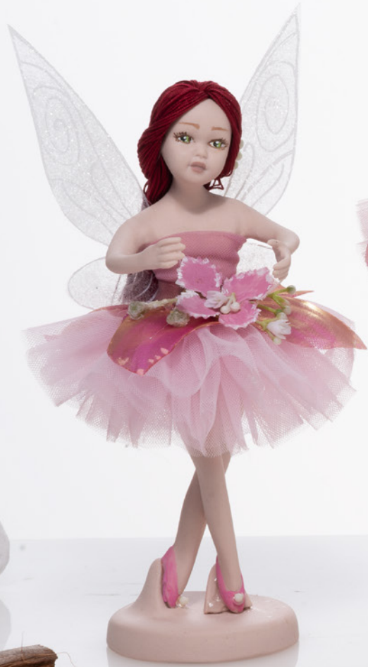
AV23-GA826/2 h. 18,5 cm