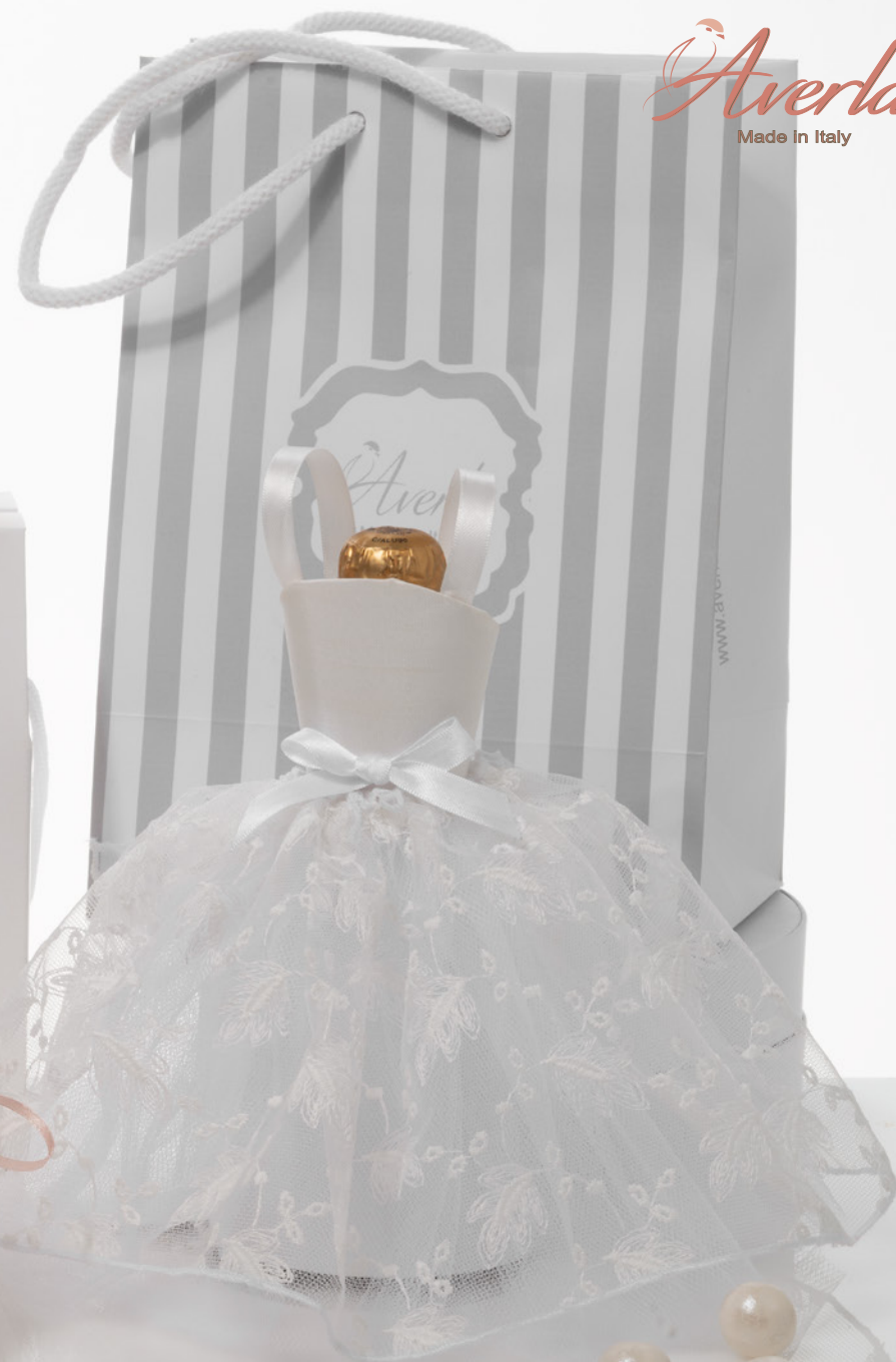
AV23-GA851 h. 19 cm