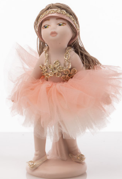
AV23-GA806/1 h. 13 cm