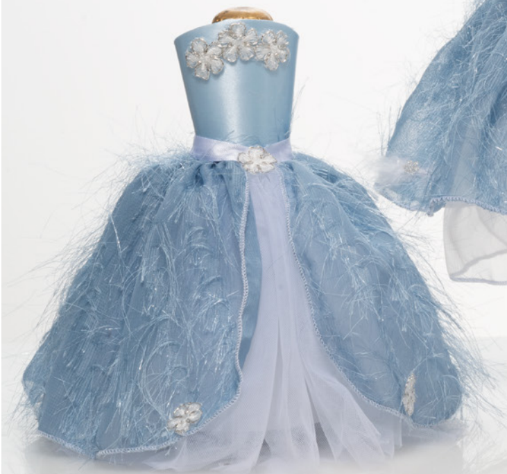
AV22-GA788/3 h. 19 cm