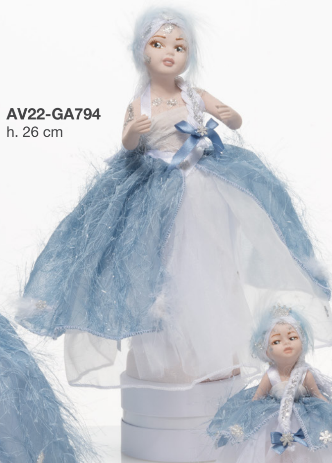
AV22-GA794 h. 26 cm