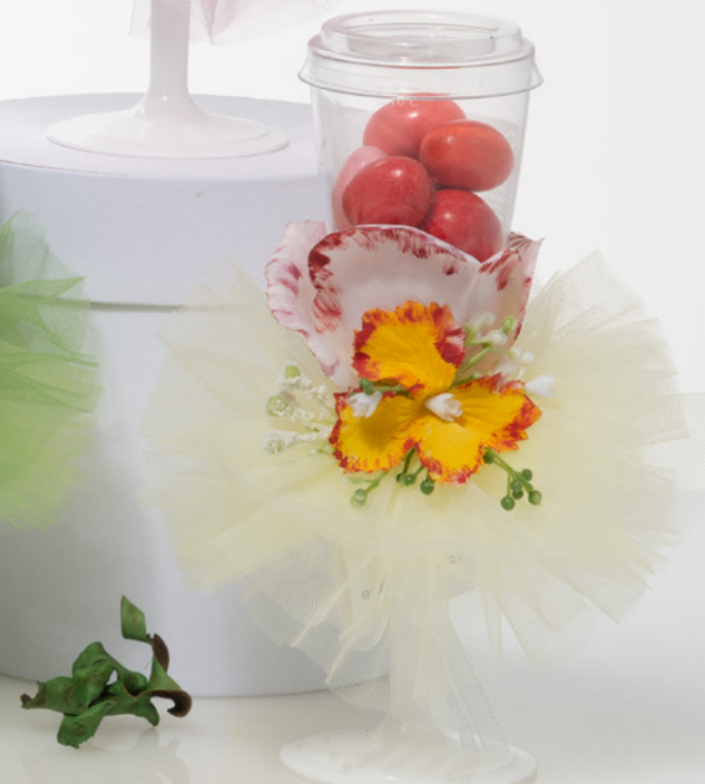
AV23-GA829/3 h. 17,5 cm