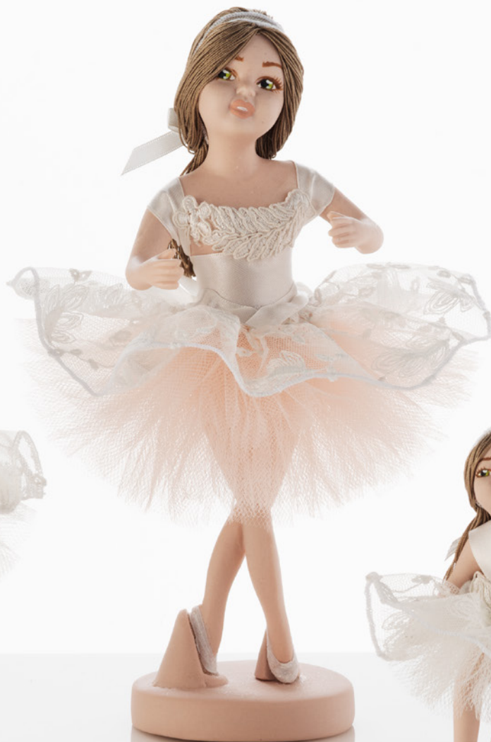
AV23-GA843 h. 26 cm