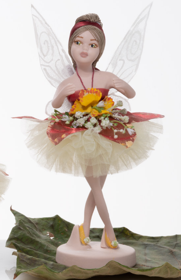
AV23-GA825/3 h. 22 cm