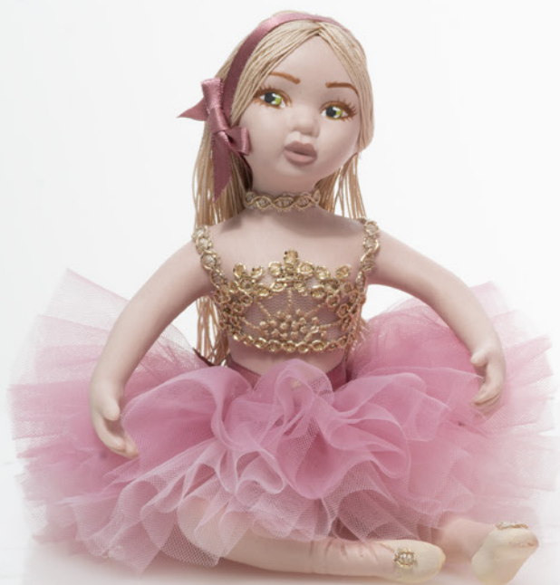
AV23-GA801/2 h. 15 cm