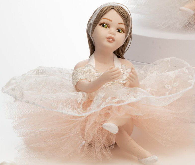
AV23-GA841 h. 15 cm