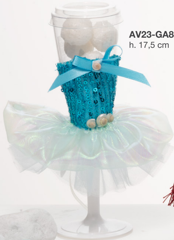
AV23-GA857/1 h. 17,5 cm