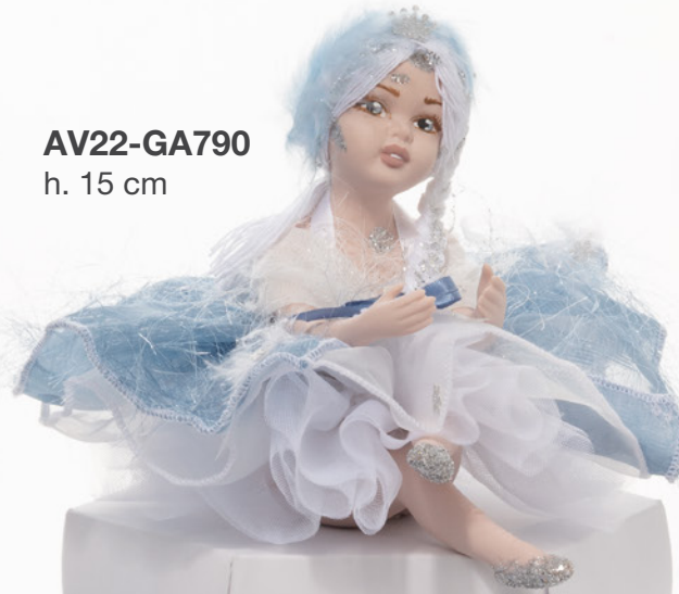
AV22-GA790 h. 15 cm