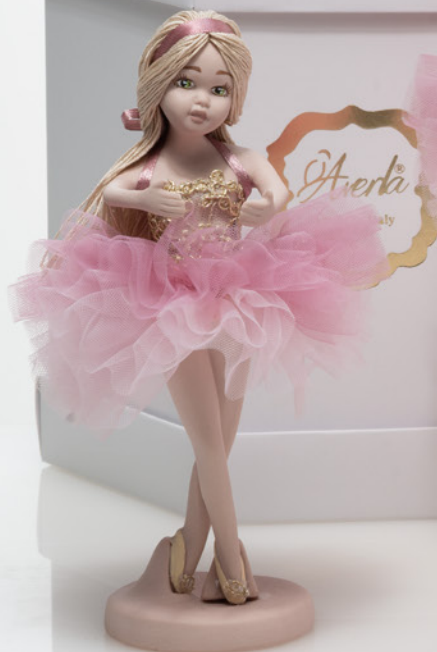
AV23-GA805/2 h. 18,5 cm