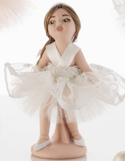
AV23-GA845 h. 13 cm