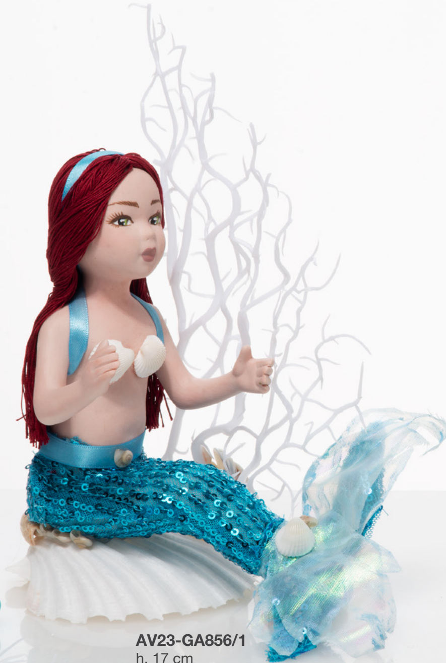
AV23-GA856/1 h. 17 cm