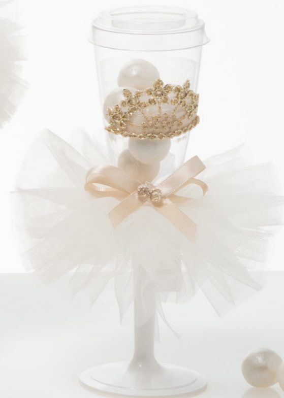
AV23-GA808/3 h. 17,5 cm