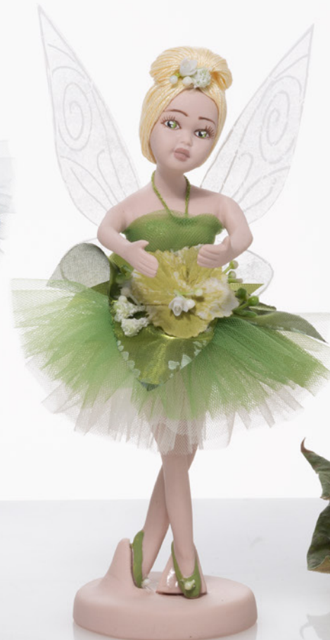
AV23-GA826 h. 18,5 cm