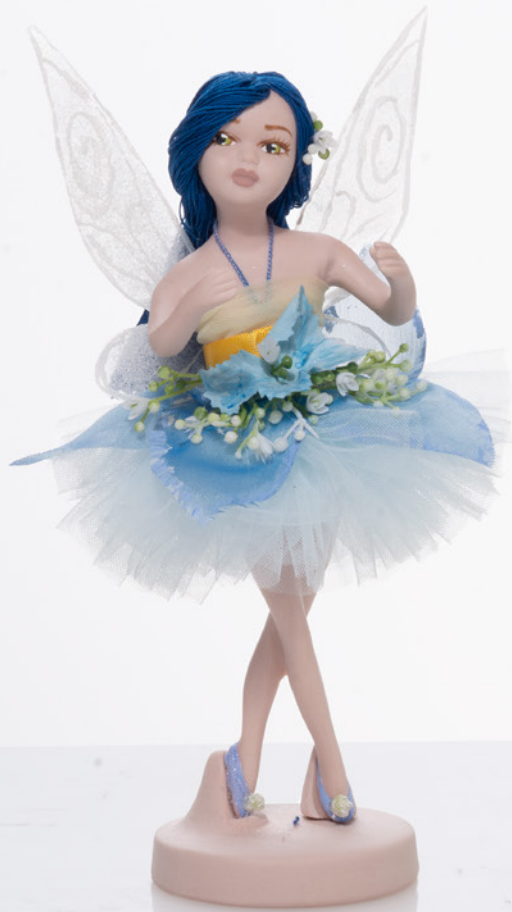
AV23-GA826/1 h. 18,5 cm