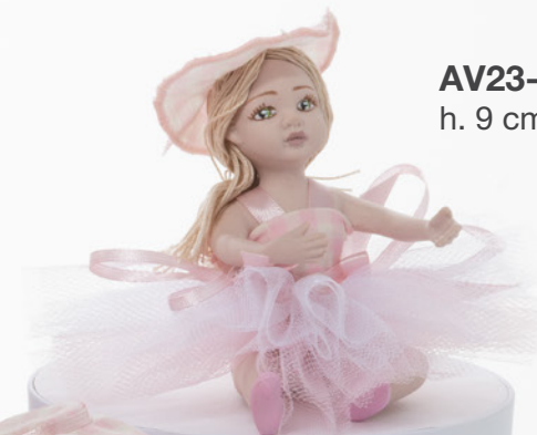
AV23-GA863 h. 9 cm