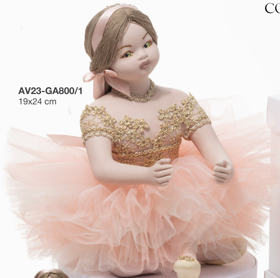
AV23-GA800/1 19x24 cm