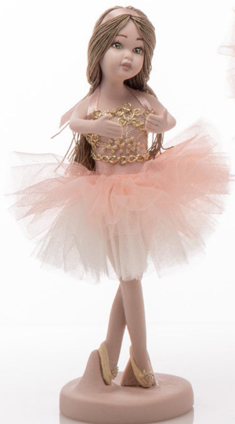
AV23-GA805/1 h. 18,5 cm