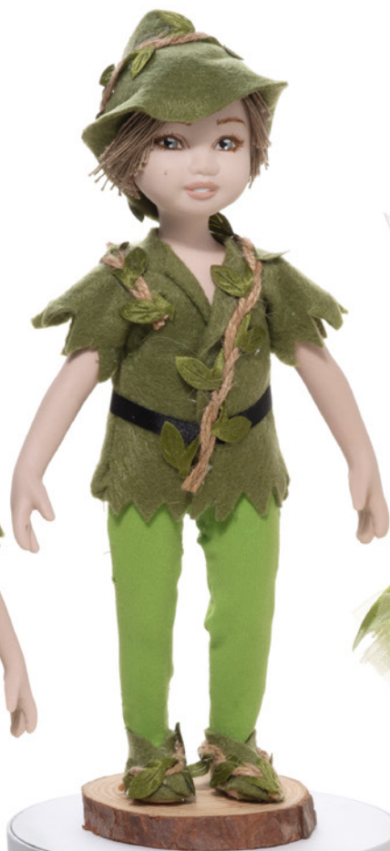
AV23-GA827 h. 27 cm