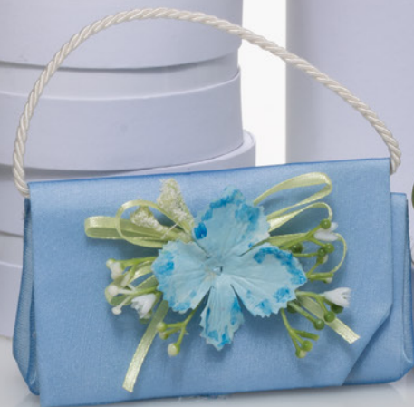
AV23-GA830/1 11x7 cm