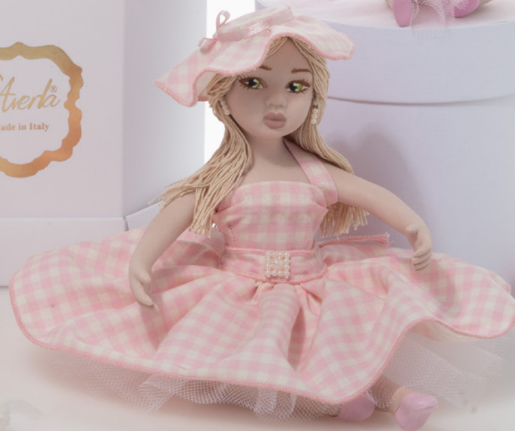
AV23-GA861 h 15 cm