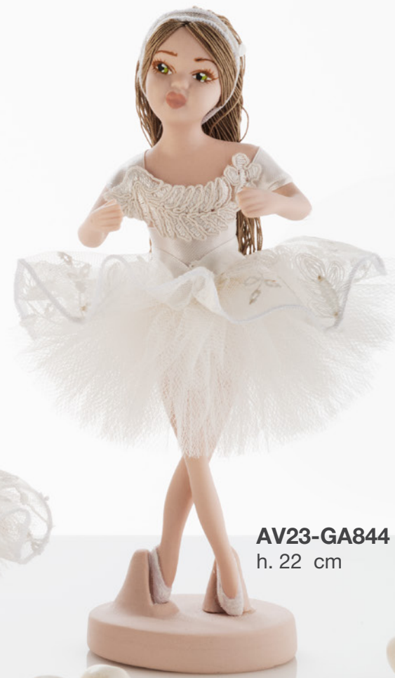
AV23-GA844 h. 22 cm