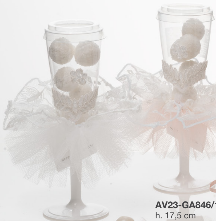
AV23-GA846 h. 17,5 cm