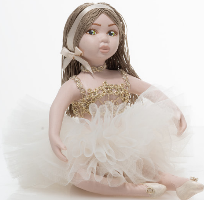
AV23-GA801/3 h. 15 cm