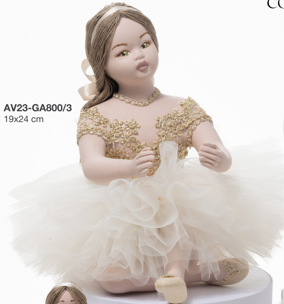
AV23-GA800/3 19x24 cm