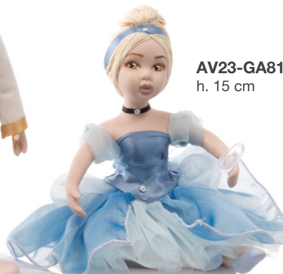
AV23-GA811 h. 15 cm