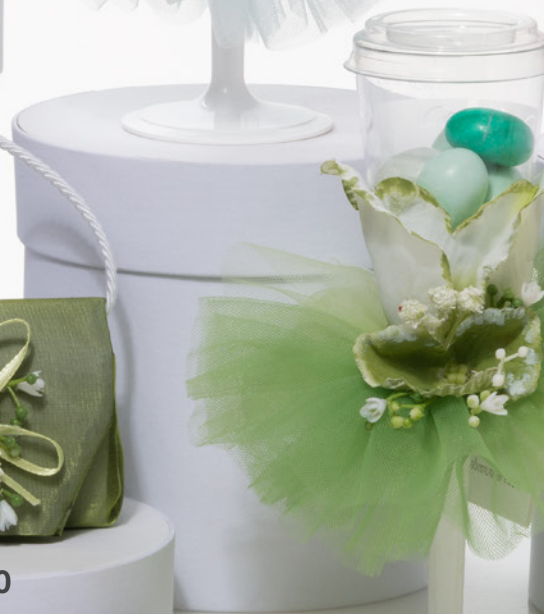
AV23-GA829 h. 17,5 cm