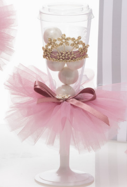
AV23-GA808/2 h. 17,5 cm