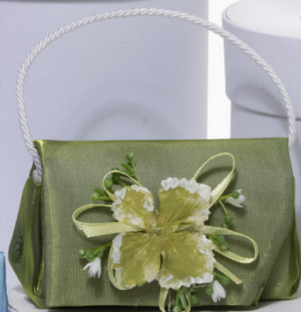
AV23-GA830 11x7 cm