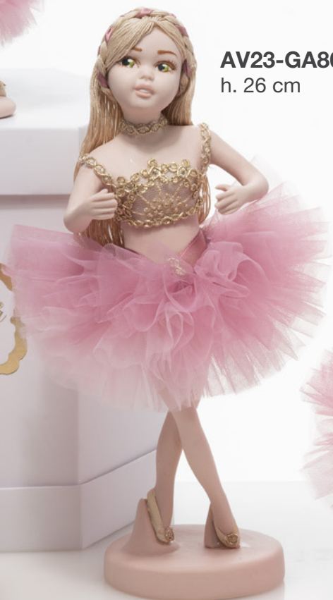
AV23-GA804/2 h. 26 cm