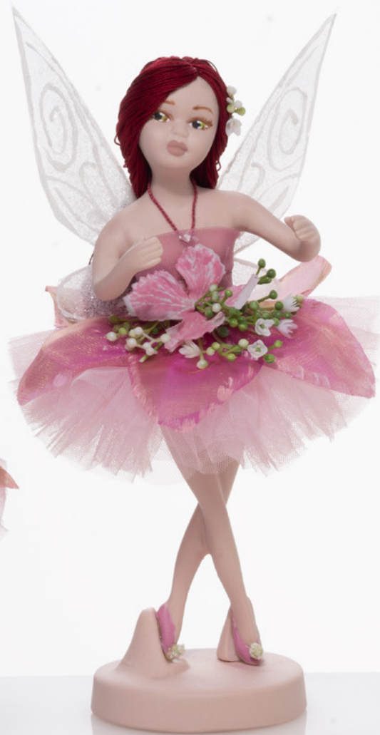
AV23-GA825/2 h. 22 cm