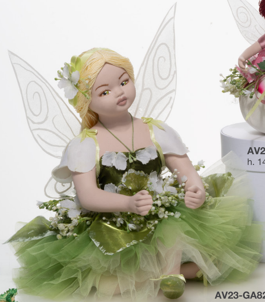
AV23-GA821 19x24 cm