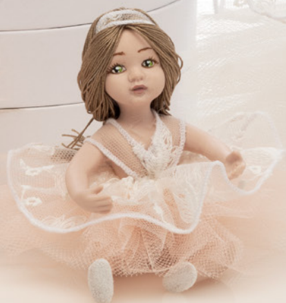
AV23-GA849 h. 9 cm