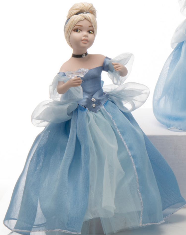
AV23-GA813 h. 26 cm