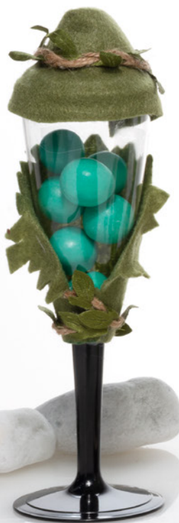
AV23-GA822 h. 17,5 cm