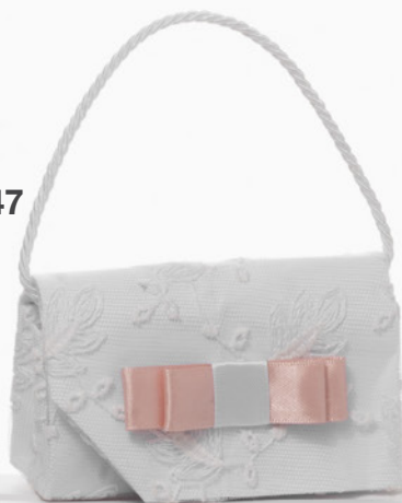
AV23-GA847 11x7 cm