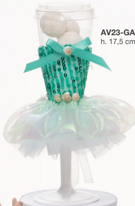
AV23-GA857/2 h. 17,5 cm