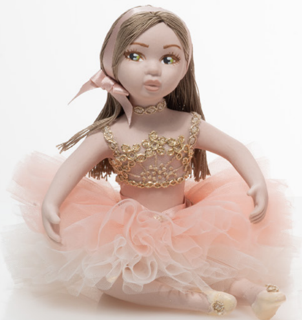
AV23-GA801/1 h. 15 cm