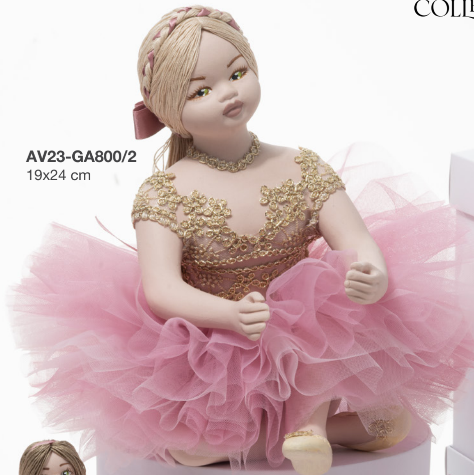
AV23-GA800/2 19x24 cm