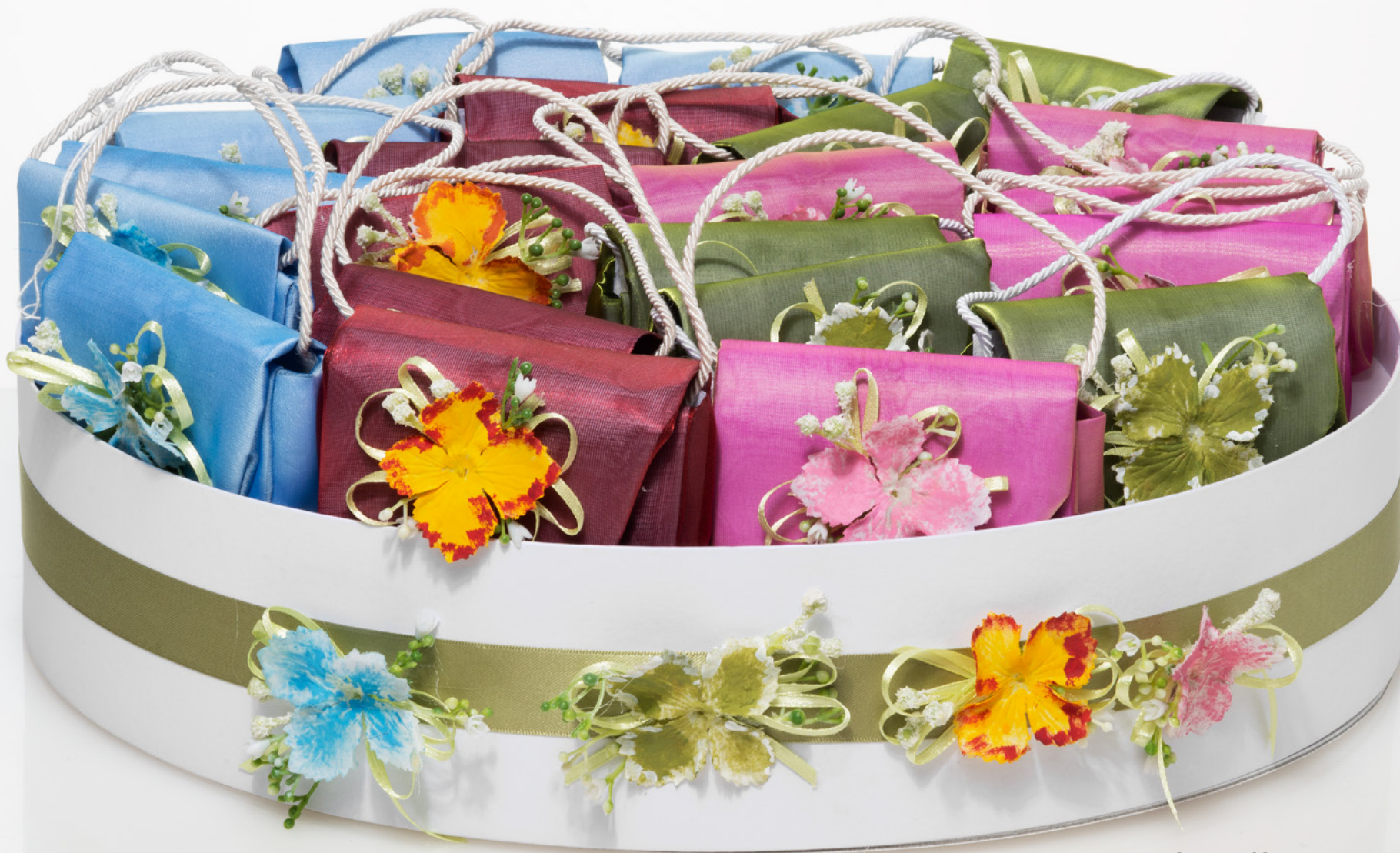
AV23-GA830/C 22 pz