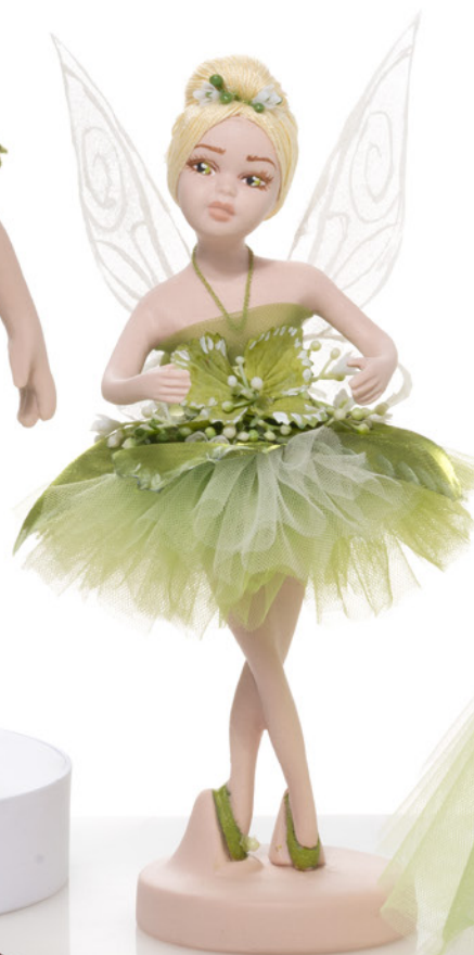
AV23-GA825 h. 22 cm