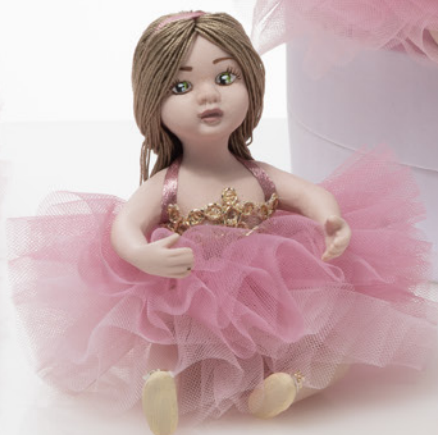
AV23-GA803/2 h. 9 cm