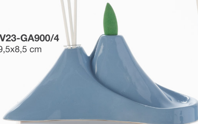
AV23-GA900/4 19,5x8,5 cm