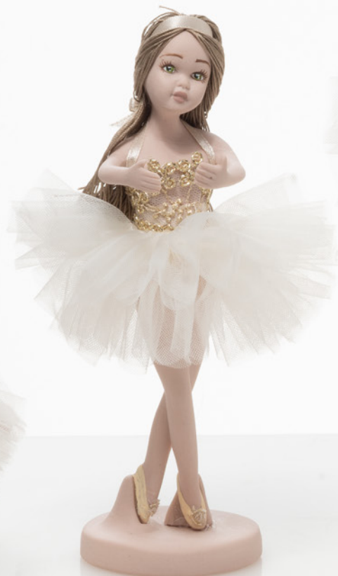
AV23-GA805/3 h. 18,5 cm