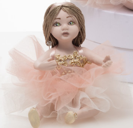
AV23-GA803/1 h. 9 cm