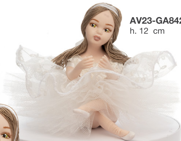
AV23-GA842 h. 12 cm