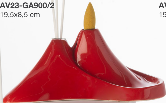
AV23-GA900/2 19,5x8,5 cm