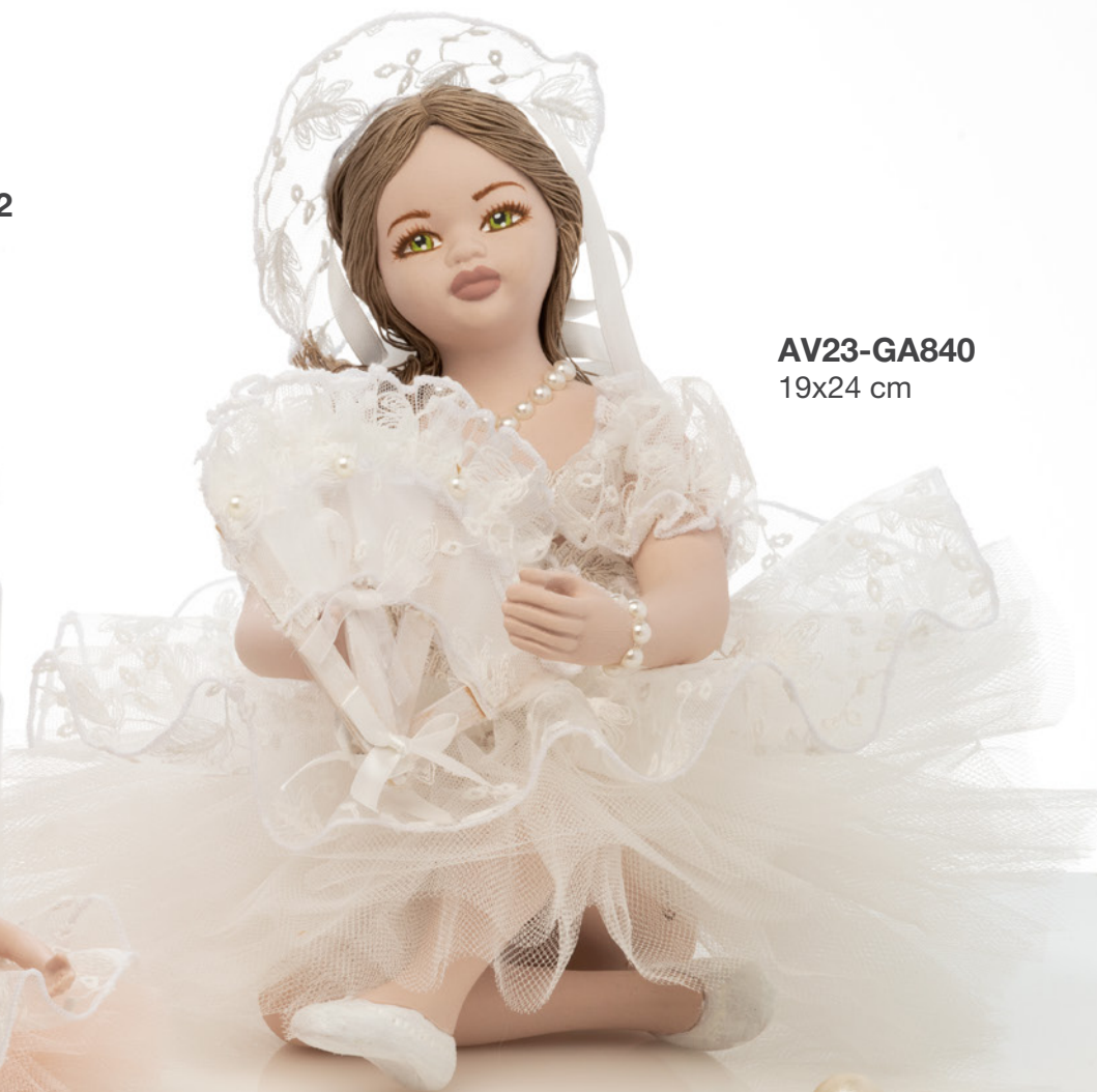
AV23-GA840 19x24 cm