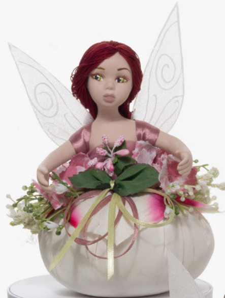
AV23-GA820/1 h. 14,5 cm