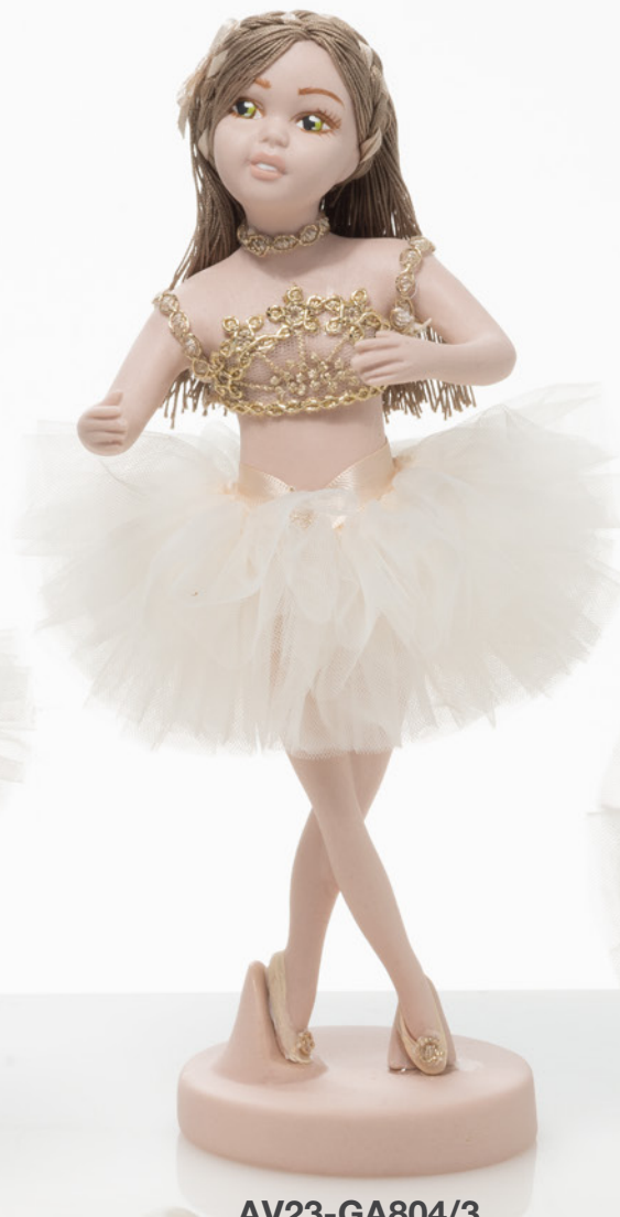
AV23-GA804/3 h. 26 cm