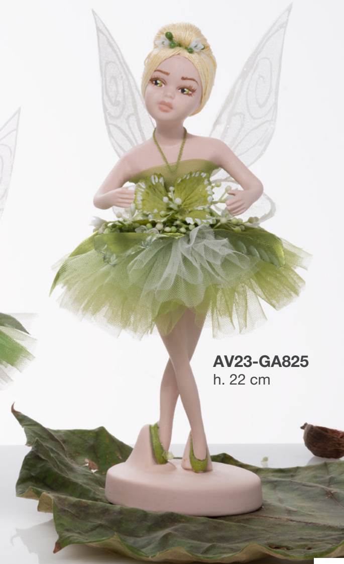
AV23-GA825 h. 22 cm