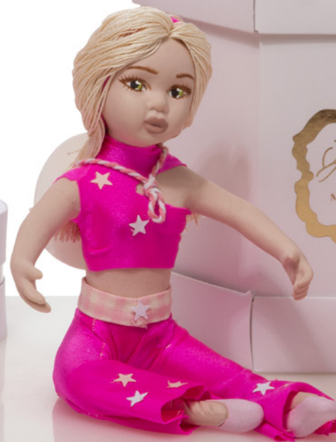
AV23-GA874 h. 15 cm