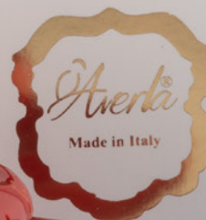
AV23-GA901/3 14x6,5 cm