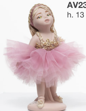
AV23-GA806/2 h. 13 cm