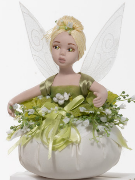
AV23-GA820 h. 14,5 cm