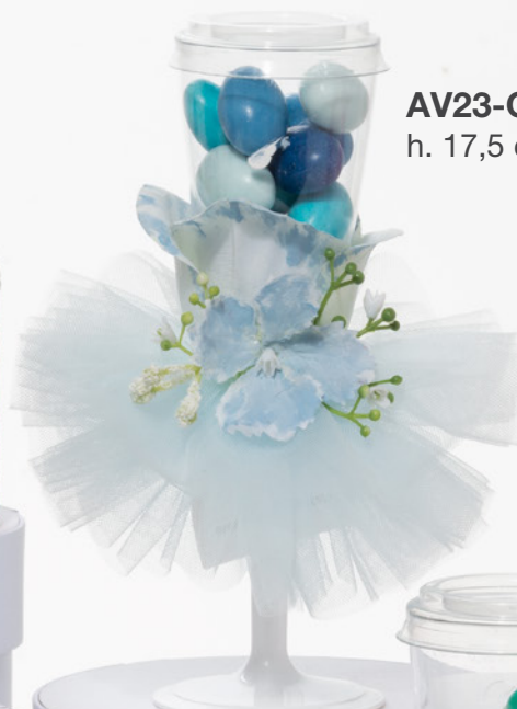
AV23-GA829/1 h. 17,5 cm