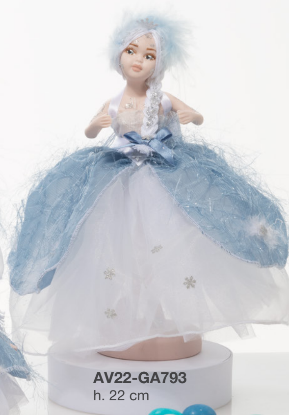
AV22-GA793 h. 22 cm