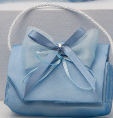
AV23-GA819 11x7 cm