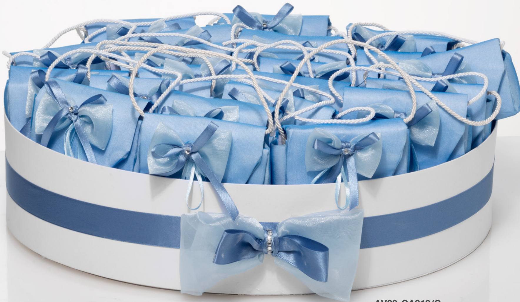
AV23-GA819/C 22 pz