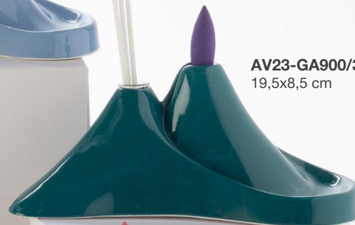
AV23-GA900/3 19,5x8,5 cm