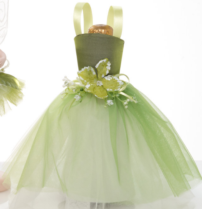
AV23-GA824 h. 19 cm