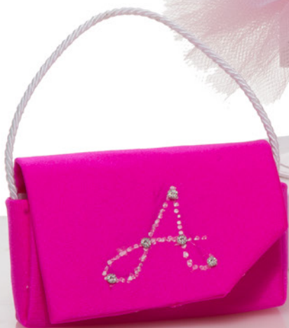
AV23-GA880 11x7 cm