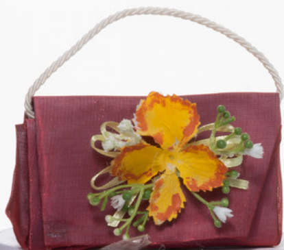
AV23-GA830/3 11x7 cm