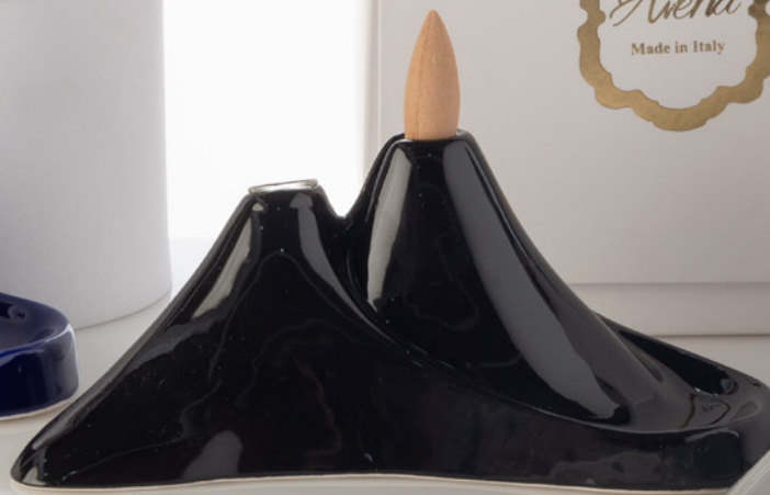
AV23-GA900/1 19,5x8,5 cm