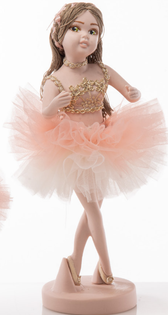
AV23-GA804/1 h. 26 cm