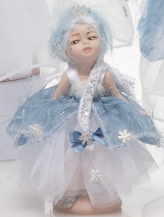
AV22-GA792 h. 13 cm