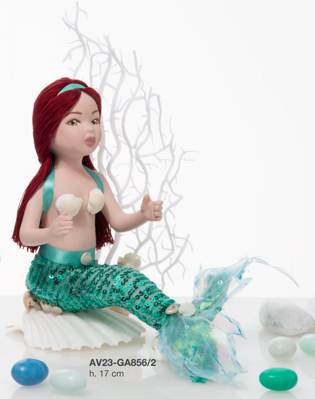
AV23-GA856/2 h. 17 cm