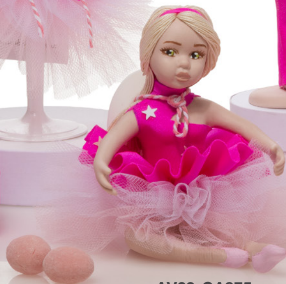
AV23-GA875 h. 12 cm