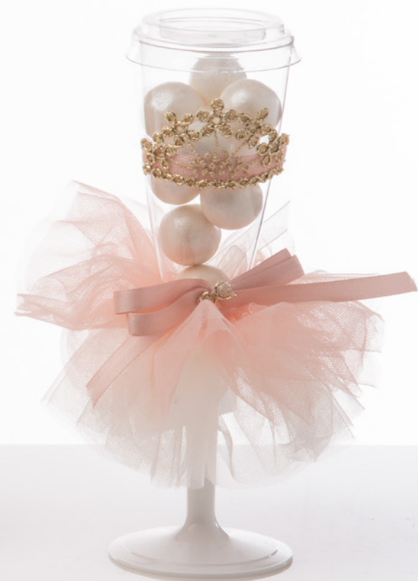
AV23-GA808/1 h. 17,5 cm