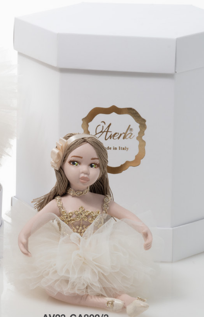
AV23-GA802/3 h. 12 cm