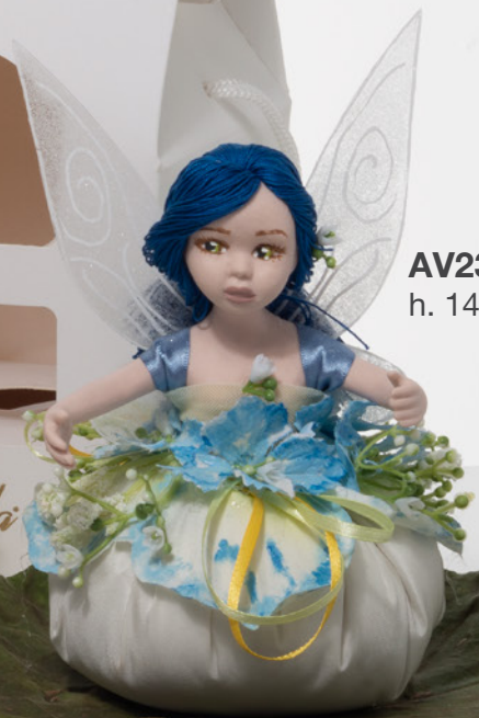
AV23-GA820/3 h. 14,5 cm