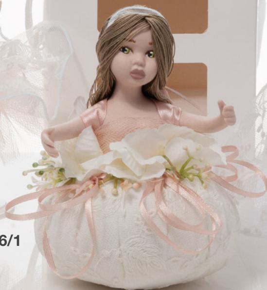
AV23-GA848 h. 14,5 cm