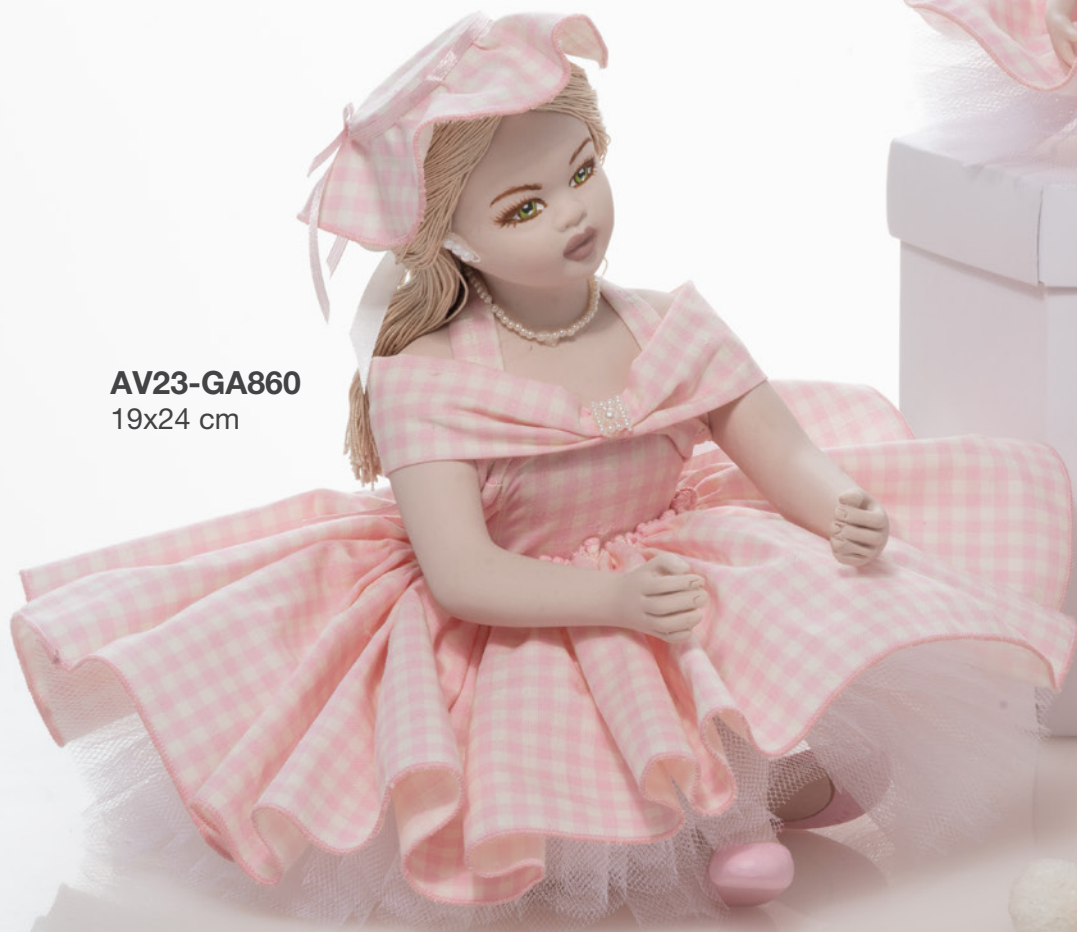
AV23-GA860 19x24 cm